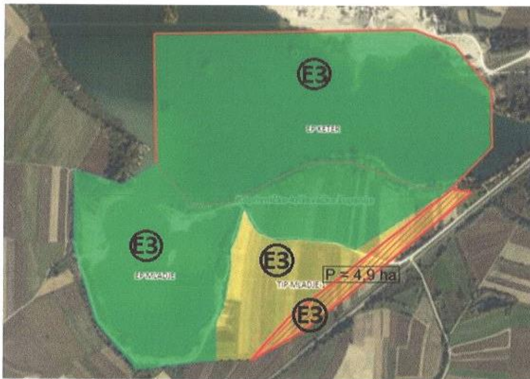
Prilog br. 2: Položajni prikaz zone za eksploataciju „Mladje 1 na području Općine Drnje